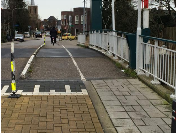
Figuur 4 Fysieke afscheiding nodig tussen rijbaan en voetpad