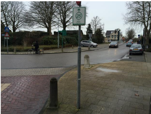
Figuur 9 Uitritconstructie komt te vervallen