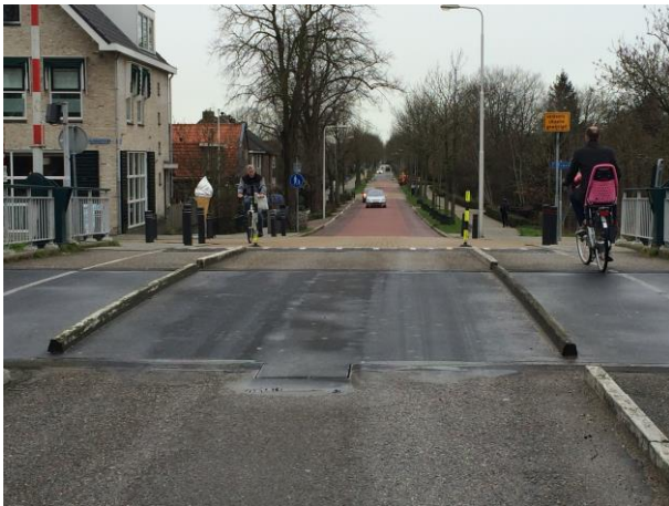
Figuur 5 Verhogingen moeten verdwijnen, gehele rijbaan openstellen