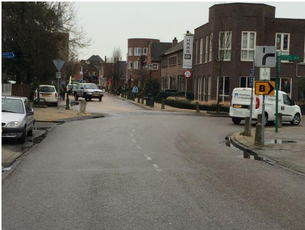
Figuur 7 Kruising Middelweg, Kerklaan, Koningin Julianastraat