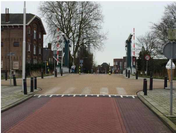
Figuur 2 Brug vanaf de Middelweg