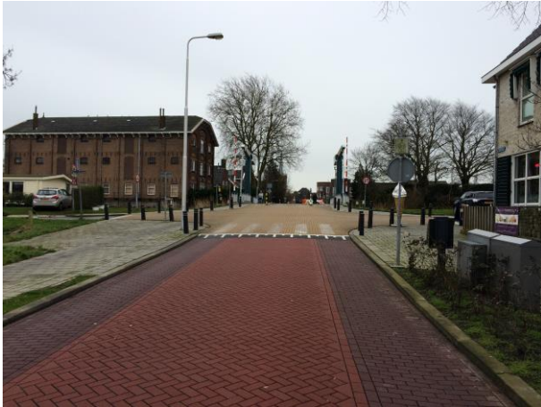
Figuur 1 Brug vanaf de Middelweg - zelfde breedte