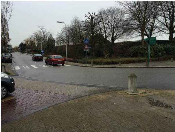
Figuur 8 Kruispunt vervangen door gelijkwaardige kruising op plateau