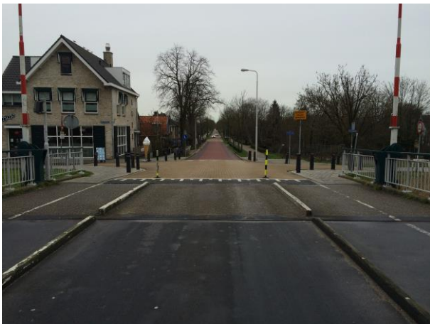
Figuur 6 Breedte rijbaan brug t.o.v. breedte Middelweg