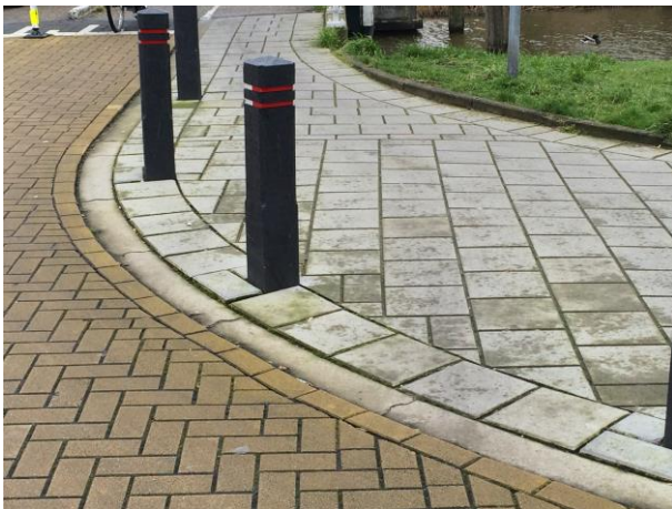
Figuur 3 Opletten dat fietsers niet gemakkelijk voetpad op kunnen rijden