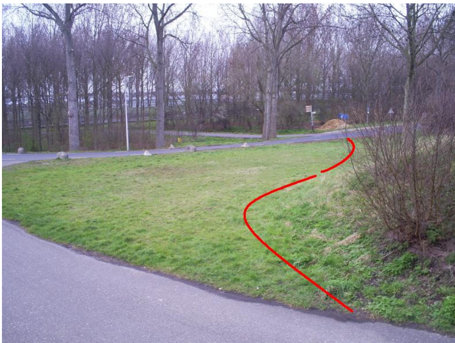
Figuur 4 Locatie (houtsnipper)pad