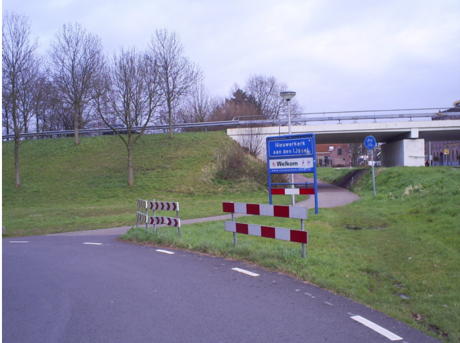
Figuur 3 Onoverzichtelijk door borden