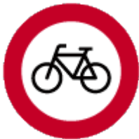
2 Gesloten voor fietsen en voor gehandicaptenvoertuigen zonder motor