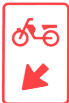
3 ov-104 Bromfietsers op de rijbaan