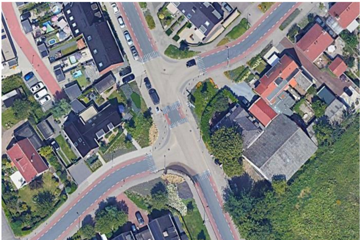
Figuur 2 Opsplitsen verkeersplateau in 2 plateaus