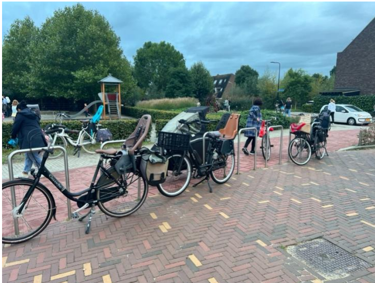
Foto 6 Geparkeerde fietsen