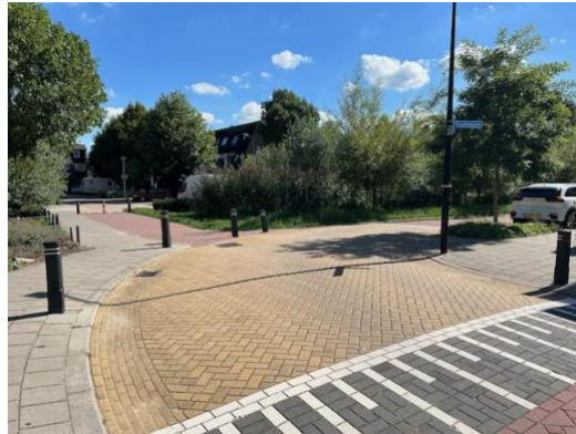
Foto 1 Gelijkwaardig plateau, maar voorrang vindt niet juist plaats