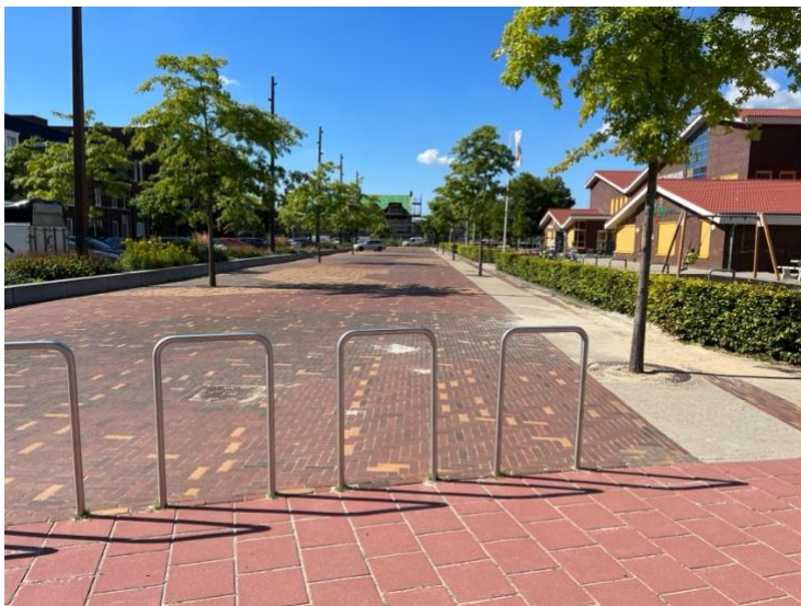
Foto 7 Nietjes vervangen door losse paaltjes, extra ruimte genereren door rechter nietje te verwijderen