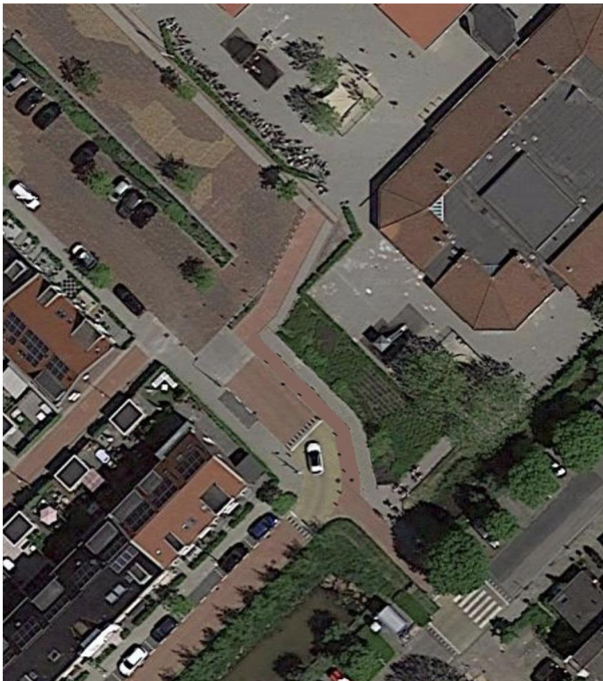
Foto 3 Ingetekend voet- en fietspad