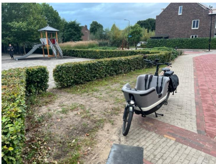
Foto 5 Braakliggend terrein met blokkerende bakfiets